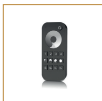
Pilot do taśm jednokolorowych Remote controller for single colour LED strips