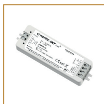
Sterownik do taśm jednokolorowych Single colour LED strips controller