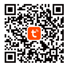
rys.3/ fig.3/ Abb.3/ рис.3