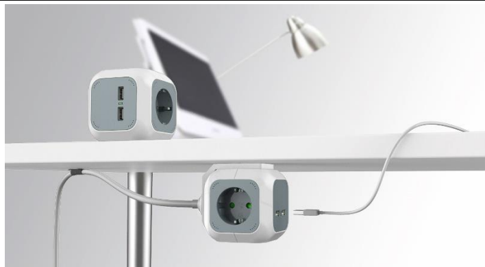
rys. 1/ fig. 1/ Abb. 1