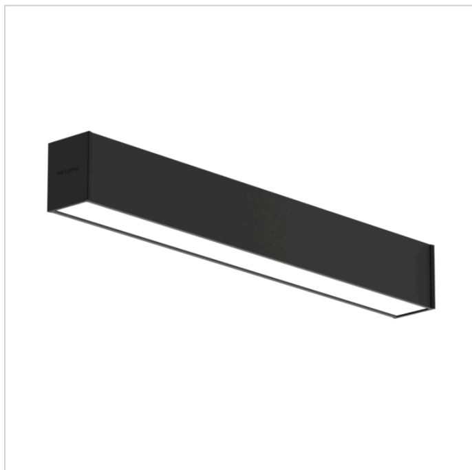
📷 Zdjęcie poglądowe dla rodziny produktów