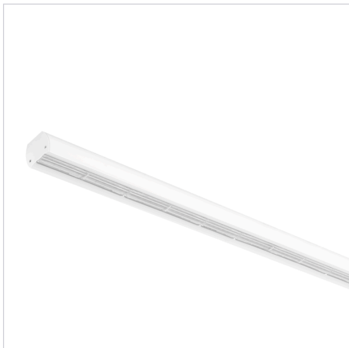
📷 Zdjęcie poglądowe dla rodziny produktów