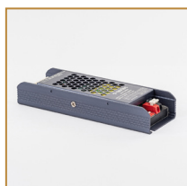
Zasilacz modułowy BLUE 100W Modular power supply BLUE 100W