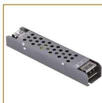
Zasilacz modułowy Graphite 60W Modular power supply Graphite 60W