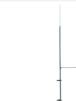
Ilustracje nie są wiążące