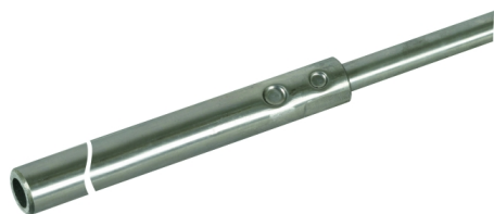
Ilustracje nie są wiążące