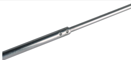
Ilustracje nie są wiążące