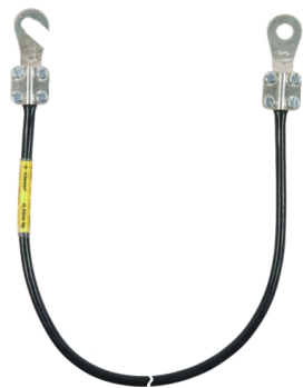
Ilustracje nie są wiążące