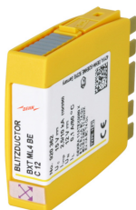
Ilustracje nie są wiążące