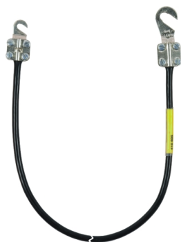
Ilustracje nie są wiążące