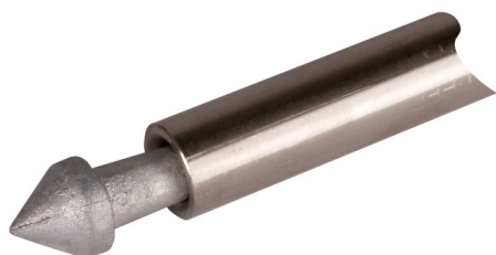
Ilustracje nie są wiążące