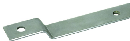
Ilustracje nie są wiążące