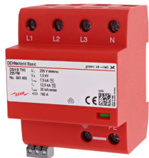
Ilustracje nie są wiążące