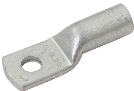
Ilustracje nie są wiążące