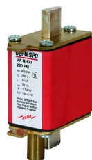
Ilustracje nie są wiążące