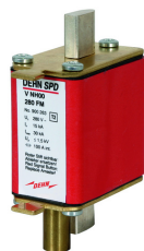
Ilustracje nie są wiążące