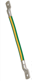
Figure without obligation