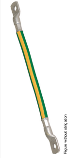
Figure without obligation