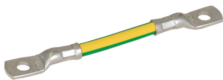
Ilustracje nie są wiążące