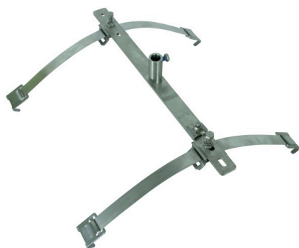
Ilustracje nie są wiążące