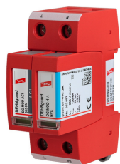
Ilustracje nie są wiążące