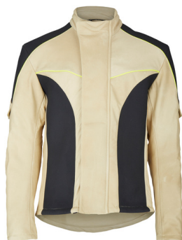
Ilustracja nie są wiążące