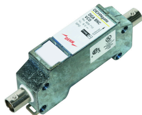
Ilustracje nie są wiążące