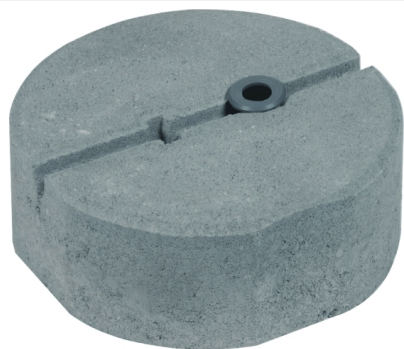
Ilustracje nie są wiążące