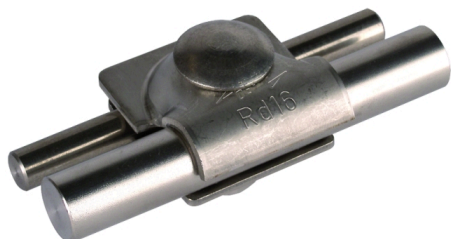
Ilustracje nie są wiążące