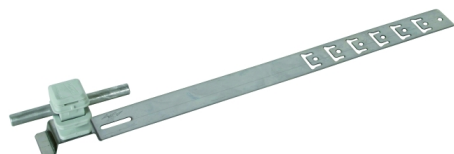
Ilustracje nie są wiążące