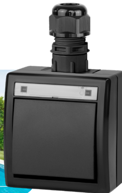
antracytowy RAL 7016