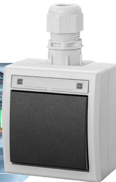
szary RAL 7035