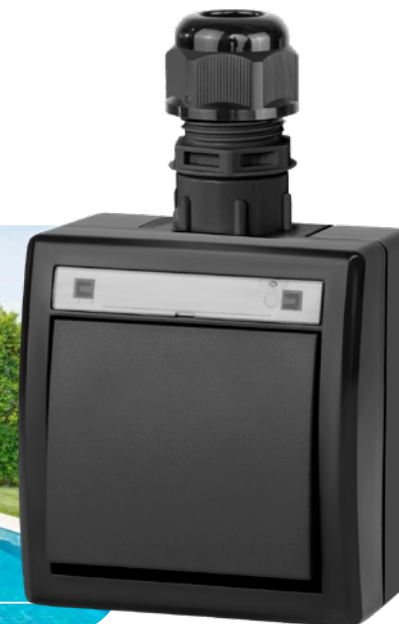
antracytowy RAL 7016