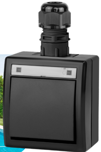
antracytowy RAL 7016