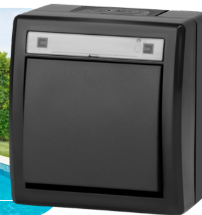
antracytowy RAL 7016