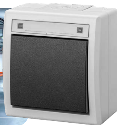
szary RAL 7035