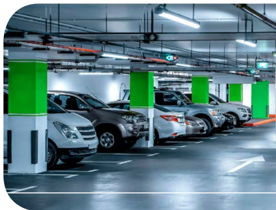
szary RAL 7035