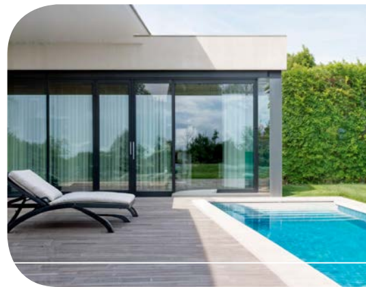
antracytowy RAL 7016