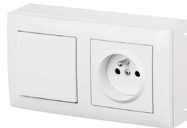
• ZASTOSOWANIE NATYNKOWE