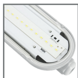
wydajne źródła światła LED