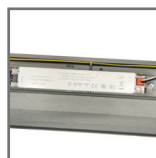
izolowany układ zasilania