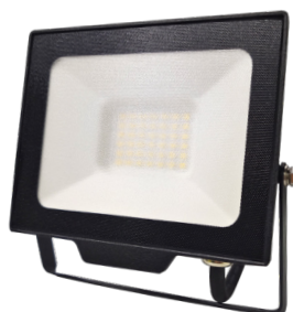
DAISY BETA 30W