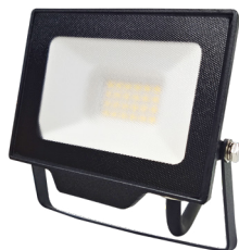
DAISY BETA 20W