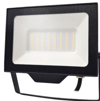
DAISY BETA 50W