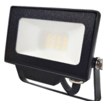
DAISY BETA 10W