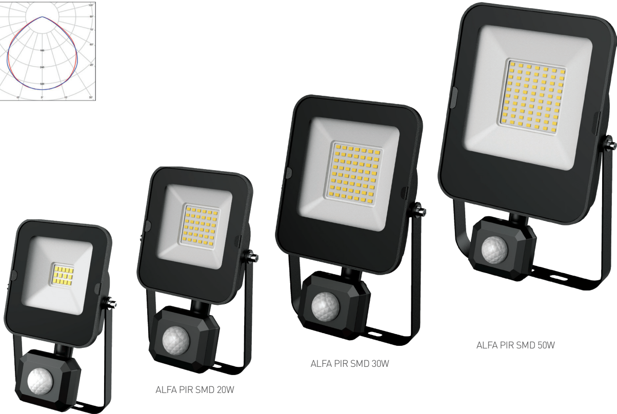
ALFA PIR SMD 10W