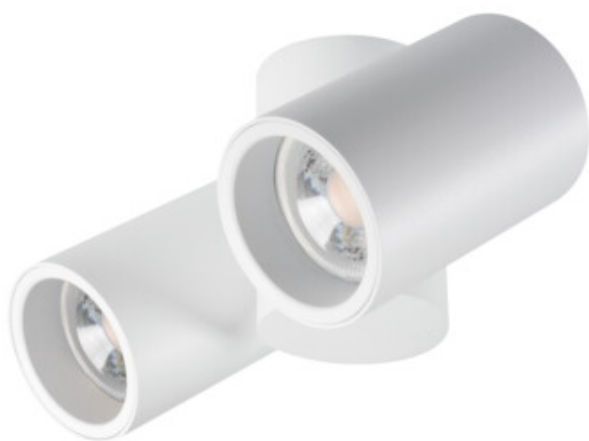
BLURRO 2xGU10 CO-W