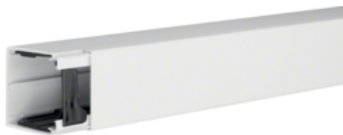
tehalit.LF Kanał elektroinstalacyjny PVC 60x60mm, biały