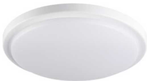
ORTE LED 18W-NW-O-SE