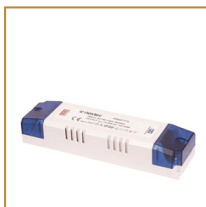
Zasilacz montażowy 80W Power supply 80W