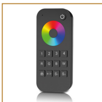
Pilot do taśm RGB Remote controller for RGB LED strips